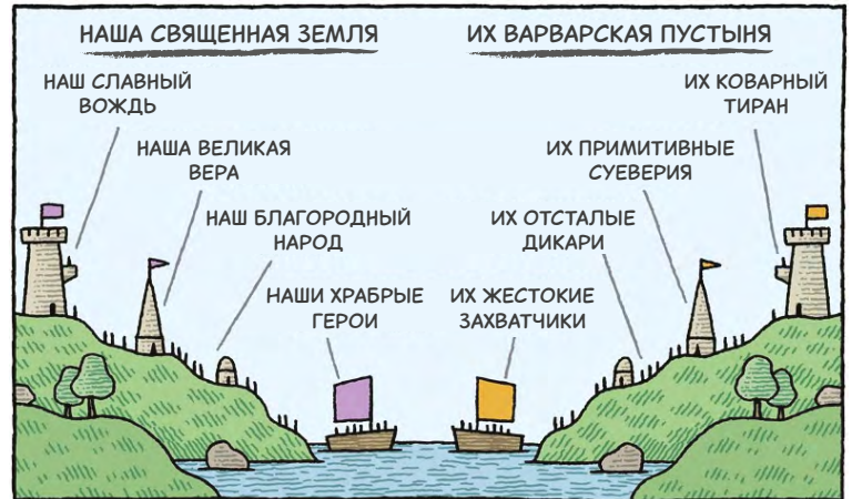
Рисунок 2.

В Совете Прессы Республики Молдова и Ассоциации Независимой Прессы (API) также доминируют представители преимущественно румынских СМИ. Русскоязычные журналисты в своем большинстве состоят в ассоциации русскоязычных журналистов Молдовы. 22 Более того, направление интереса этих двух групп журналистов — румыно-язычных и русскоязычных — часто радикально различается. Эти разногласия привели к тому, что медиа-сообщество Молдовы фрагментировано и внутренне разобщено.